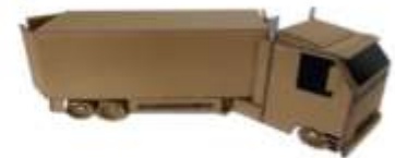
6.1 Eğitim materyali (Nakliye aracı)