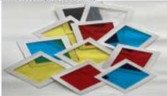
3.1 Eğitim materyali