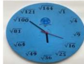
5.1 Eğitim materyali (Karekök saat)

28 2022/392 Tasarımlar Bölümü Türk Patent ve Marka Kurumu Yayın Tarihi : 13.07.2022