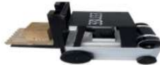
2.1 Eğitim materyali (Forklift)