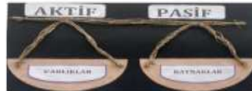
4.1 Eğitim materyali

2022/392 Tasarımlar Bölümü Türk Patent ve Marka Kurumu Yayın Tarihi : 13.07.2022 127